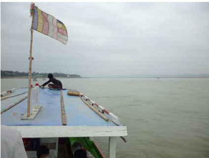
ミャンマーの“大地の母”イラワジ河を渡る