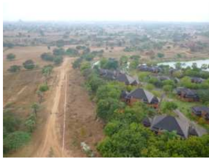
仏教都市バカン 多数の“パゴダ”を見ることができました。絶景です。