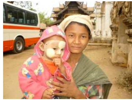
現地の親子 顔に“タナカ”のお化粧