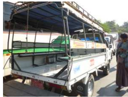
荷物車を改造した現地タクシー(10名乗り)