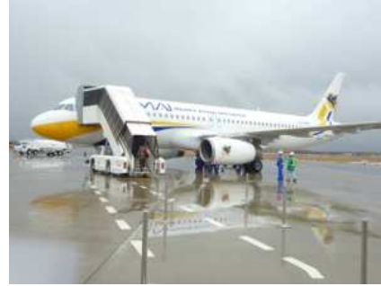
ミャンマー航空のチャーター便 第3便で出発